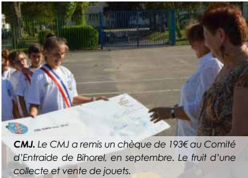
CMJ. Le CMJ a remis un chèque de 193€ au Comité d'entraide de Bihorel, en septembre. Le fruit d'une collecte et vente de jouets.