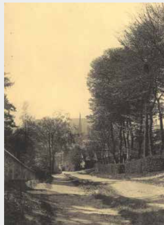
Versant Est. La Sente aux Bœufs à Bihorel devient en 1944 la rue des Canadiens sur Bihorel et Rouen.