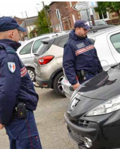
Les ASVP - Agents de Surveillance de la Voie Publique - travaillent en étroite collaboration avec les policiers municipaux.

La Ville de Bihorel emploie actuellement deux ASVP : Agents de Surveillance de la Voie Publique. Que font ces hommes en bleu ? Quelles sont leurs missions ?