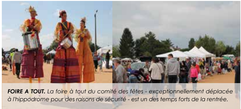
FOIRE A TOUT. La foire à tout du comité des fêtes - exceptionnellement déplacée à l'hippodrome pour des raisons de sécurité - est un des temps forts de la rentrée.