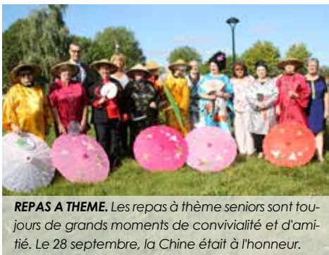
REPAS A THEME. Les repas à thème seniors sont toujours de grands moments de convivialité et d'amitié. Le 28 septembre, la Chine était à l'honneur.