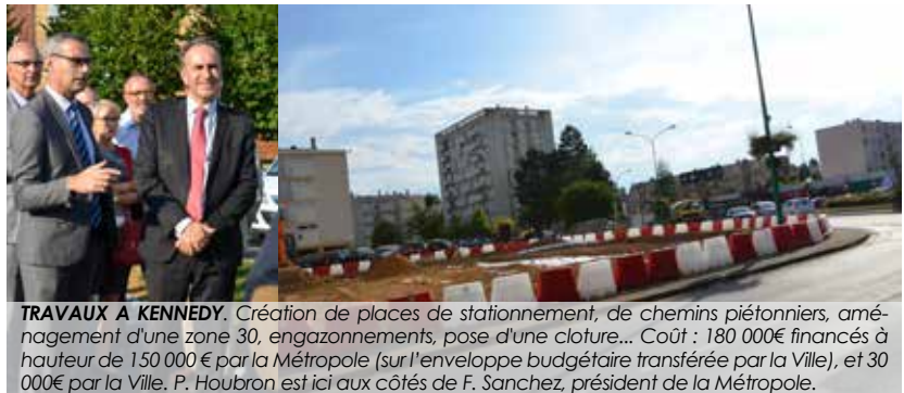
TRAVAUX A KENNEDY. Création de places de stationnement, de chemins piétonniers, aménagement d'une zone 30, engazonnements, pose d'une clôture... Coût : 180 000€ financés à hauteur de 150 000 € par la Métropole (sur l'enveloppe budgétaire transférée par la Ville), et 30 000€ par la Ville. P. Houbron est ici aux côtés de F. Sanchez, président de la Métropole.