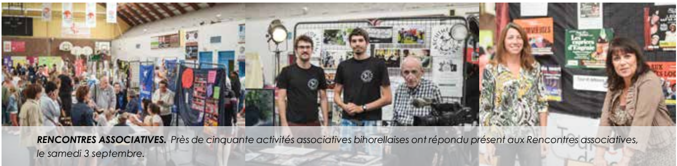
RENCONTRES ASSOCIATIVES. Près de cinquante activités associatives bihorellaises ont répondu présent aux Rencontres associatives, le samedi 3 septembre.