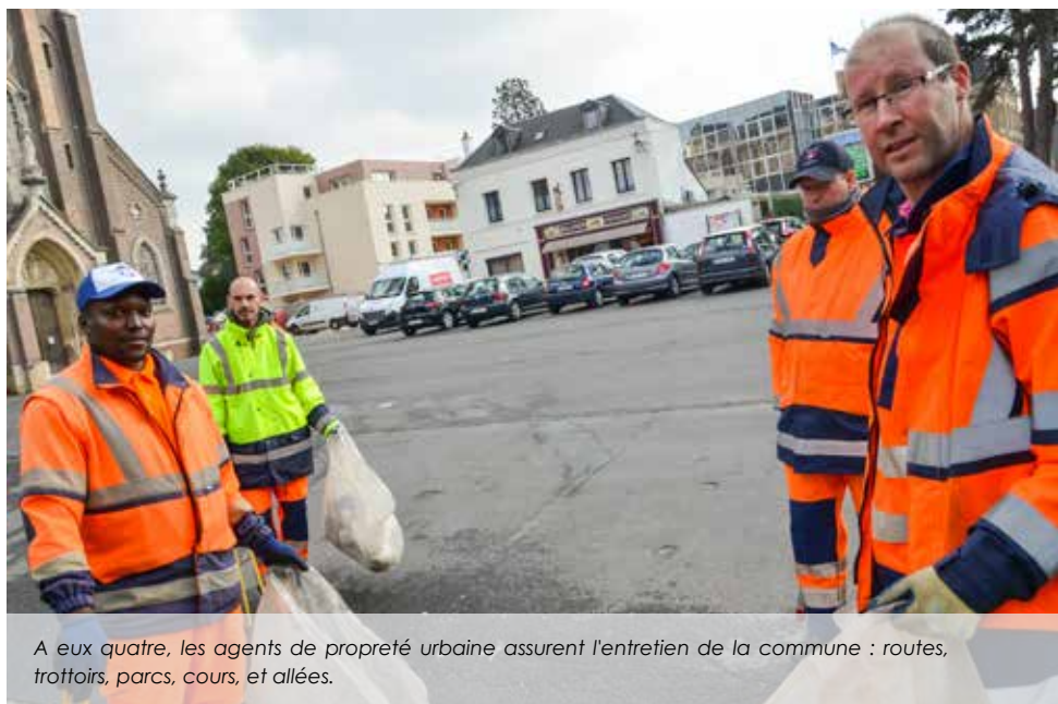
A eux quatre, les agents de propreté urbaine assurent l'entretien de la commune : routes, trottoirs, parcs, cours, et allées.

A cela, s'ajoute le laborieux nettoyage matin et soir des quatre toilettes publiques, l'ouverture et la fermeture du cimetière, ou encore l'enlèvement de déchets, d'animaux morts, de bris de verre... sur la chaussée : une centaine de