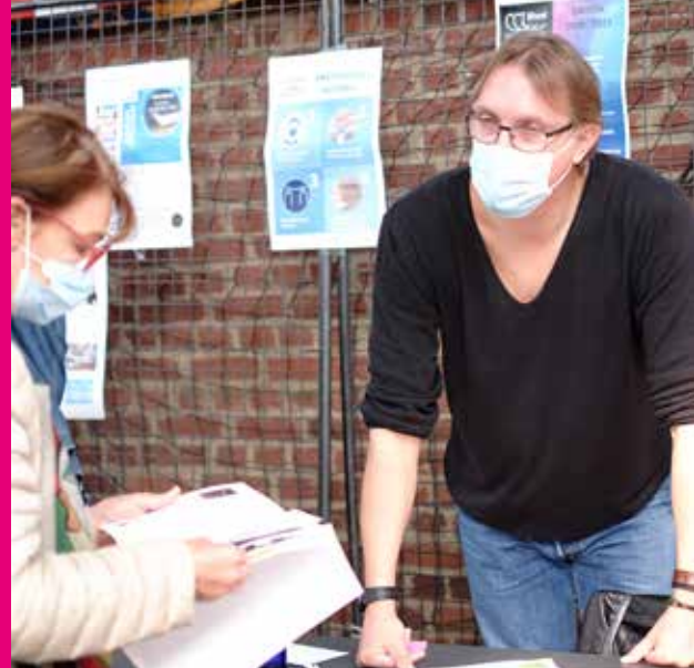
A la rentrée, retrouvons nos clubs, nos associations. Retrouvons le plaisir d'être ensemble.