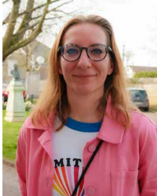
Cette habitante du Chapitre vient de lancer une friperie en ligne pour enfants.

Et j'ai l'impression de participer à quelque chose : mon projet s'inscrit dans un autre modèle économique que celui de la fast fashion, plus respectueux de notre planète.