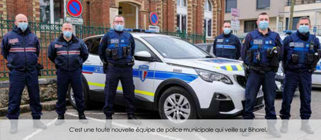
C'est une toute nouvelle équipe de police municipale qui veille sur Bihorel.