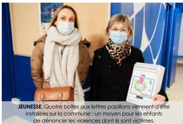
JEUNESSE. Quatre boîtes aux lettres papillons viennent d'être installées sur la commune : un moyen pour les enfants de dénoncer les violences dont ils sont victimes.