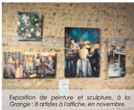
Exposition de peinture et sculpture, à la Grange : 8 artistes à l'affiche, en novembre.