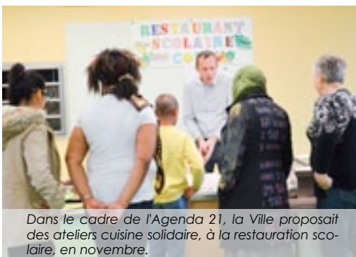
Dans le cadre de l'Agenda 21, la Ville proposait des ateliers cuisine solidaire, à la restauration scolaire, en novembre.