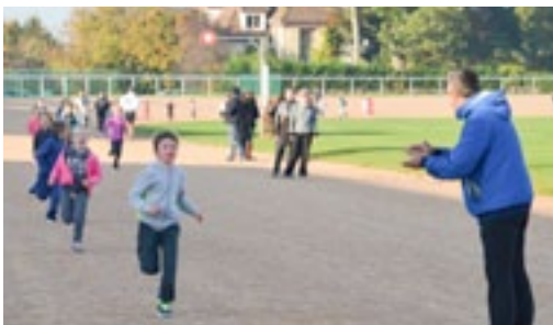
En octobre, le cross est le grand rendez-vous sportif des élèves des écoles élémentaires.