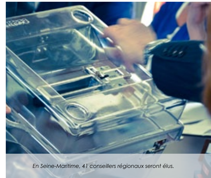
En Seine-Maritime, 41 conseillers régionaux seront élus.

La loi NOTRe (nouvelle organisation territoriale de la République) adoptée par le Parlement le 16 juillet, a fixé les compétences des collectivités territoriales. Les régions interviennent sur le développement économique,