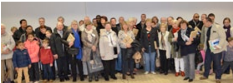
Les nouveaux habitants de Bihorel sont venus en nombre à la cérémonie d'accueil qui leur était réservée, le samedi 24 octobre.