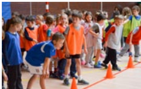
En octobre-novembre, les élèves de primaire se sont affrontés lors de rencontres athlétiques.