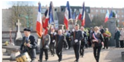
Cérémonie du 11 Novembre, en présence des personnalités locales.