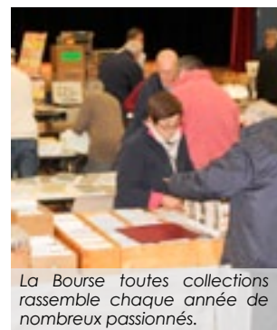
La Bourse toutes collections rassemble chaque année de nombreux passionnés.